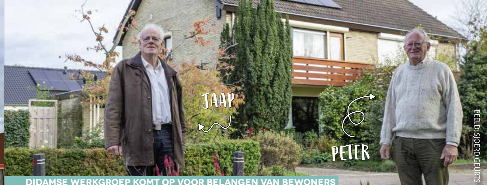
DIDAMSE WERKGROEP KOMT OP VOOR BELANGEN VAN BEWONERS